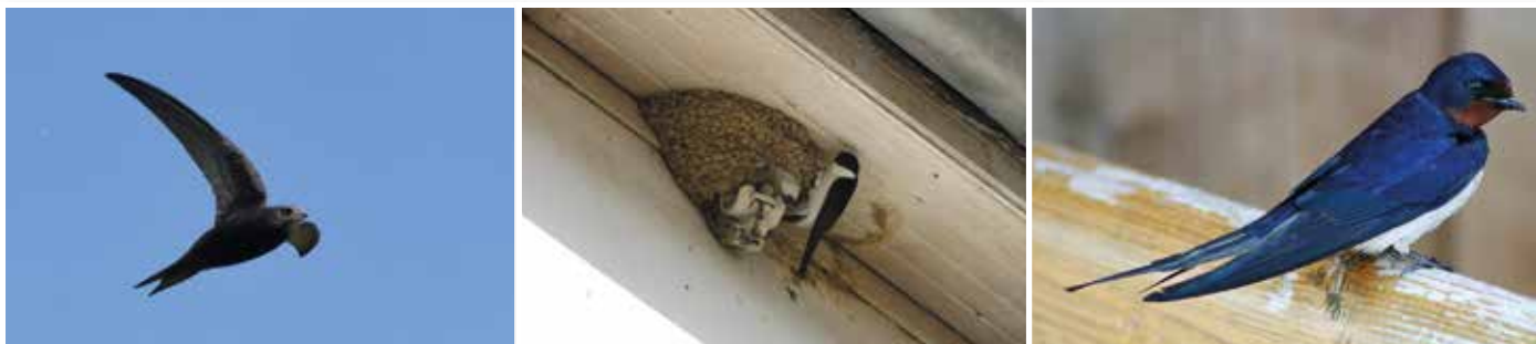
De gauche à droite : Martinet noir ( Apus apus ). ; Hirondelle de fenêtre ( Delichon urbicum ) et nid. ; Hirondelle rustique ( Hirundo rustica ).

Un individu peut voler jusqu'à plusieurs millions de kilomètres dans sa vie (longévité d'une vingtaine d'années).