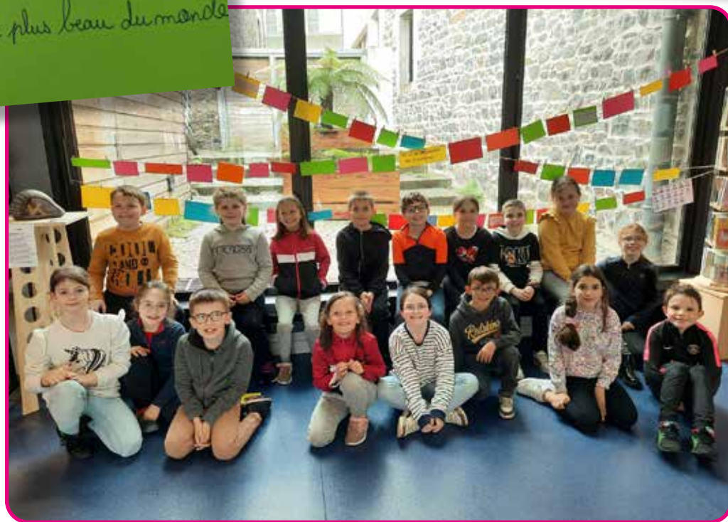
Les élèves de CE2/CM1 au vernissage de leur exposition