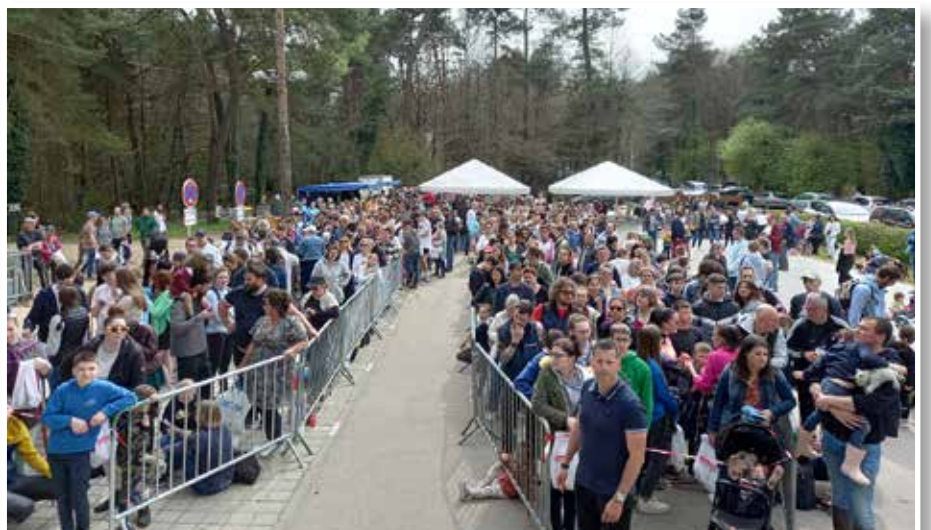
Le nombreux public au moment du dépouillement.