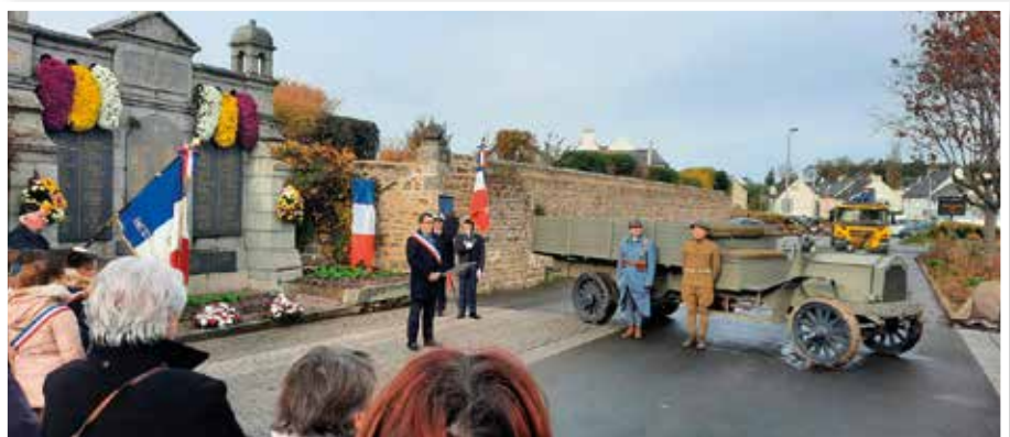
Sur le parvis du monument aux Morts, une assemblée attentive et recueillie.