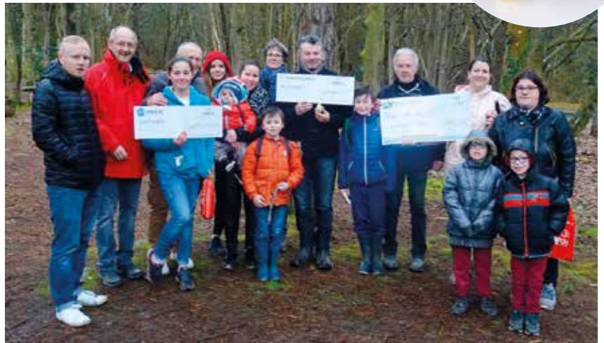
Les gagnants de la chasse aux œufs 2018

4 000 euros de lots à gagner, dont l'œuf du comité des fêtes, d'une valeur de 1 000 euros.