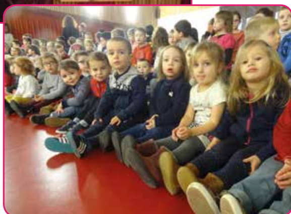
Un jeune public conquis.