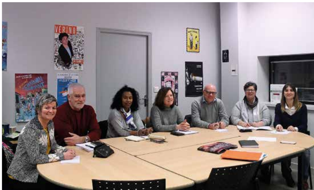
La commission Évènementiel et valorisation du patrimoine

La commission "Évènementiel et valorisation du patrimoine" lance de nouveau le concours photos 2019 sous l'appellation "Patrimoine et moments de vie locale" exclusivement réservé aux Plédranais(es).