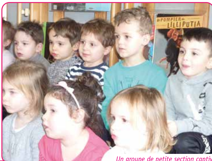
Un groupe de petite section captivé par une histoire.

Les enfants apprécient ces moments consacrés à la découverte et à l'exploitation de la richesse et de la densité de la littérature