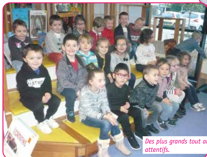
Des plus grands tout aussi attentifs.

de jeunesse. Celles-ci permettent d'offrir des lectures adaptées en fonction de l'âge des auditeurs-spectateurs.