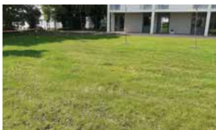
Dans le jardin de l'EHPAD

Dans le même temps, les services ont réfléchi à un autre mode de fonctionnement. Ainsi, des espaces verts seront volontairement non tondus pour laisser place à la biodiversité.