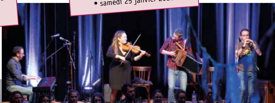
Association Zef et Mer

Zonk : Festival Zef et mer • samedi 25 janvier 2020