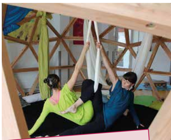
Cies Erézance et Les Voyageurs, Immobiles

EVEIL ET MOI COMPLET SUR L'ENSEMBLE DES SEANCES • Lundi 13, mardi 14 et jeudi 15 janvier 2020 : 8 séances scolaires • Mercredi 15 janvier 2020 : tout-public