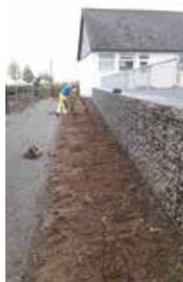
Derrière la maison des associations

Ils ont commencé par les plantations à l'EHPAD et derrière la Maison des associations pour éviter la perte de l'ensemble des plants commandés avant le confinement.