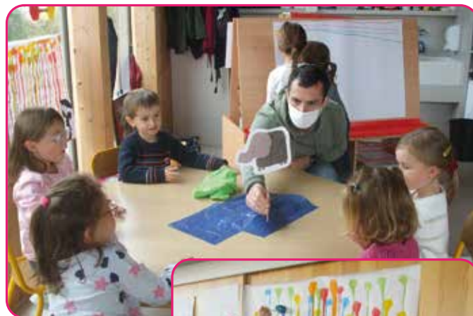
Les élèves de CP en pleine séance d'arts-visuels.

Ci-dessous, un atelier de langage oral en breton. Les élèves de MS et de GS apprennent à raconter l'histoire de Gurwant an olifant avec des margottes.