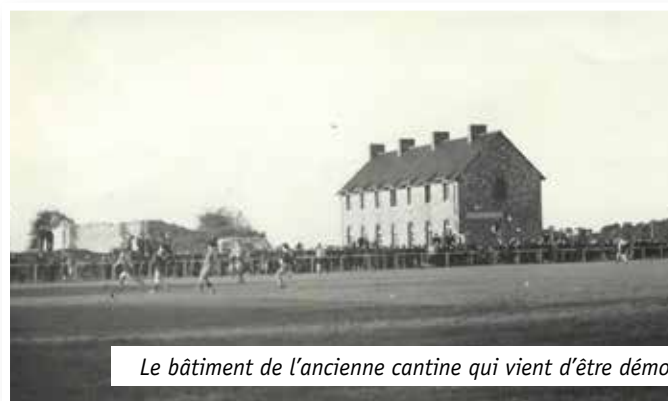
Le bâtiment de l'ancienne cantine qui vient d'être démoli