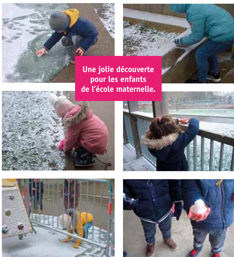
Une jolie découverte pour les enfants de l'école maternelle.