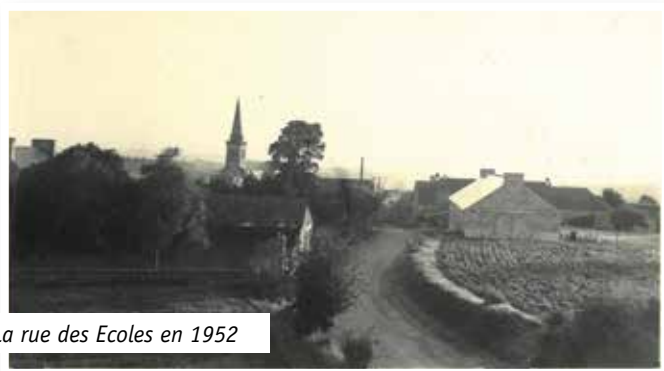
La rue des Ecoles en 1952

C'est lui qui a eu l'idée ; il a constaté que les enfants mangeaient sous le préau leur repas froid ou allaient le manger dans les cafés du bourg. Il a donc organisé une réunion avec les parents d'élèves à laquelle seulement trois sont venus !