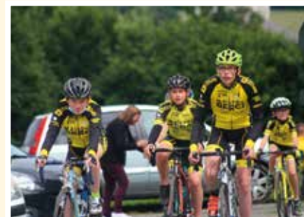
En attendant le passage des coureurs du Tour de France, le vélo club de Moncontour a réalisé des démonstrations.