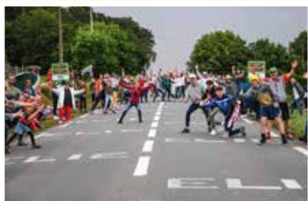
Le public venu nombreux