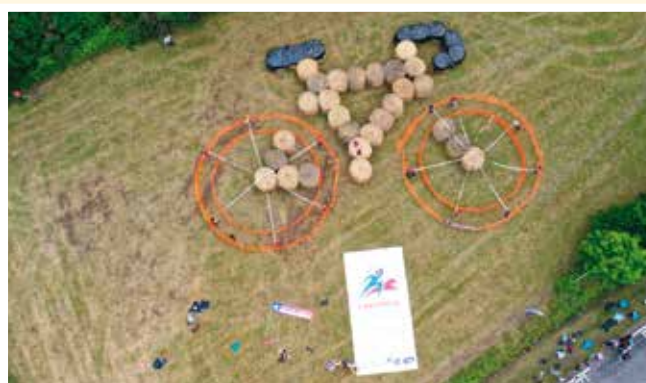
Bravo aux agriculteurs pour leur belle réalisation, en collaboration avec l'association Canicrossbreizh, afin de mettre en avant les championnats du Monde de Canicross en 2022 à Plédran