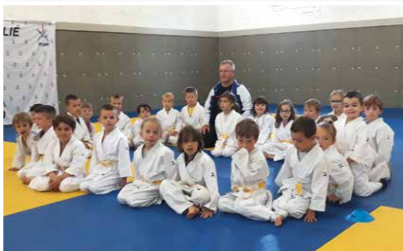
Les 5-6 ans le jour de l'interclubs à Quintin le mercredi 30 juin.