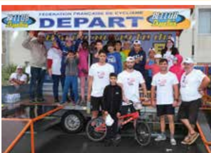
Le secours populaire pour son animation « Les Oubliés du sport »