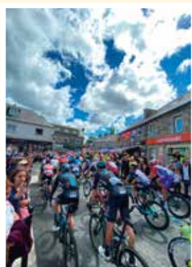
Les commerçants pour avoir décorer leur vitrine