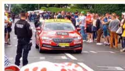
La voiture de Christian Prudhomme, directeur du Tour de France, s'est arrêtée en haut de Magenta, avec, à l'intérieur, le Prince Albert II de Monaco.