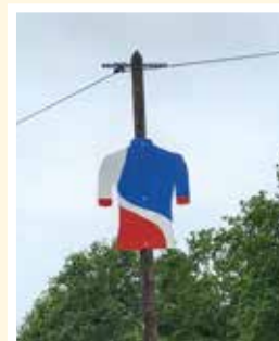
Silhouettes réalisées par les services techniques, décorées par les enfants des centres de loisirs.