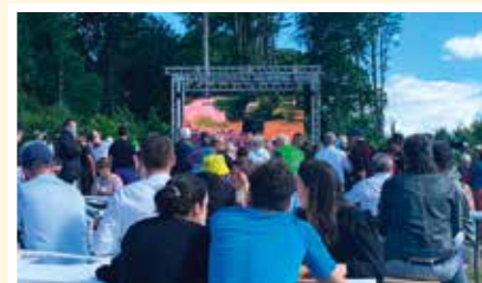
Loops pour l'écran géant