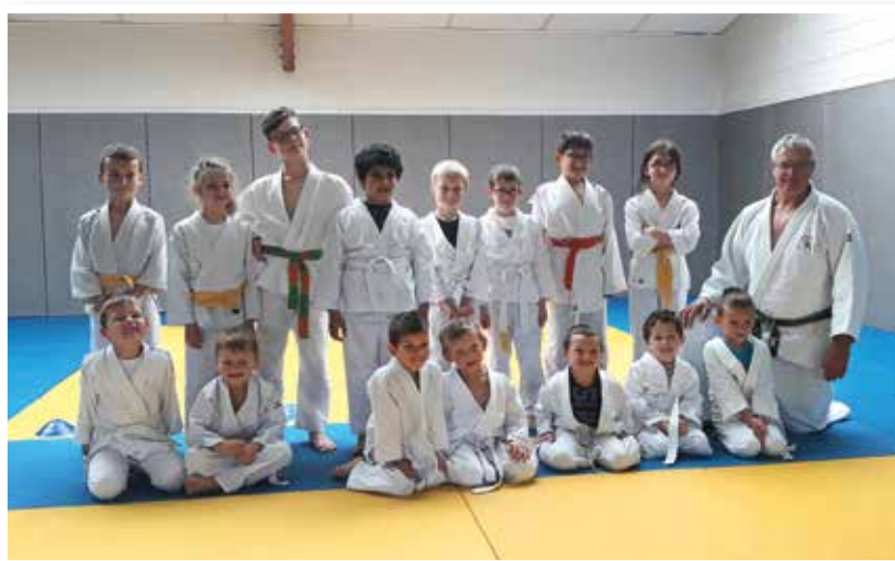
Photo de groupe avec les petits du groupe 1 (au 1 er rang les 5-6 ans) et debout au 2 ème rang le groupe 2 (les 6-8 ans) lors de la dernière séance à Plédran le mardi 29 juin.

Le rendez-vous est donné à tous pour le forum des associations début septembre pour la reprise.