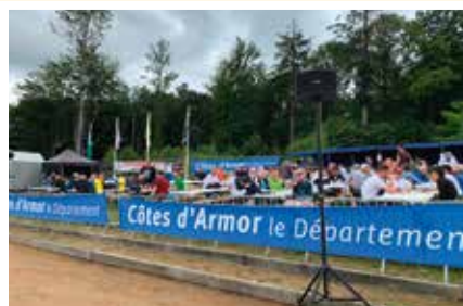
Le comité des fêtes pour la buvette et la restauration dans le respect des règles sanitaires