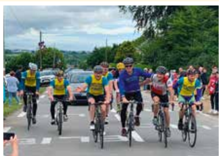
D'anciens coureurs cyclistes Plédranais ont réalisé en vélo la montée de la côte de Magenta, avant le passage des coureurs