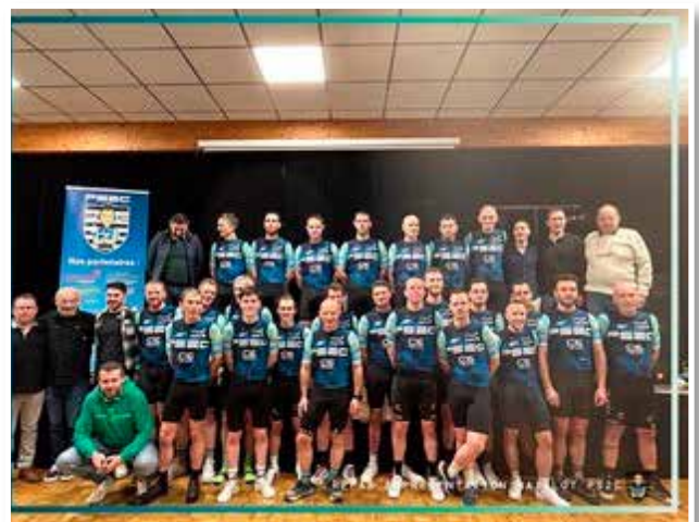
La Team PS2C lors de la présentation officielle à St-Carreuc le 27 janvier dernier.