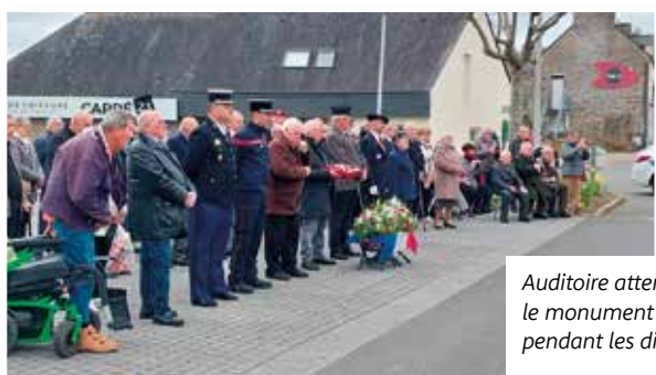
Auditoire attentif devant le monument aux Morts pendant les discours.