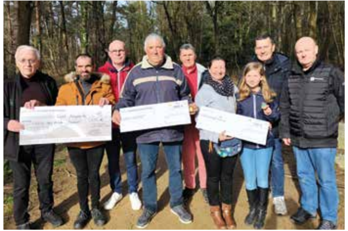
Les principaux lauréats en compagnie des organisateurs

Il est à noter, cette année, la présence d'une famille venue de Lyon (69) participer à cette 28 ème édition. Un grand merci à l'ensemble des bénévoles, partenaires, artisans et commerçants pour leur confiance et fidélité.