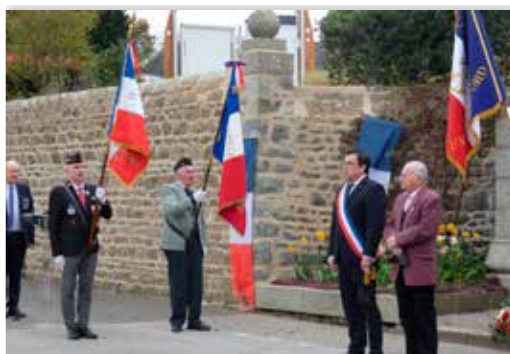
Instant solennel de la Marseillaise chantée « A Capella »

Les 6 médaillés en présence de M. le Maire, du président de la FNACA, des différents présidents des associations patriotiques avec leurs drapeaux (cols bleus et anciens combattants et de l'ANT-TRN), de représentants gendarmerie et pompiers, et du conseiller délégué aux commémorations.