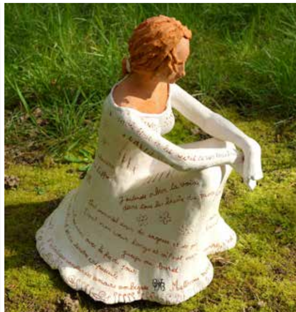
Faïence rose, engobe, technique du « sgraffite » pour graver des fragments de poèmes d'Aragon, Eluard, Anna de Noailles, Georges-Emmanuel Clancier, Nâzım Hikmet, Primo Levi...

https://delaterreetdesmots.wordpress.com/