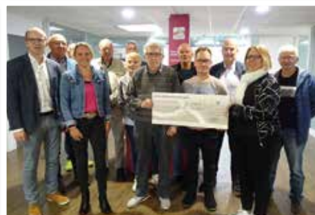
Responsables du CMB, le conseil d'administration et des membres de Plédran Solidarité, lors de la remise du chèque de 1 000 €.