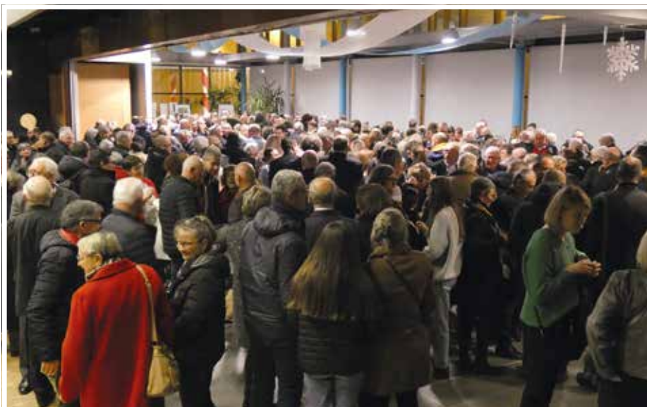
Plus de 450 personnes ont participé au moment convivial

En fin de cérémonie, les mères Noël et les membres de l'association Amitié Loisirs, jury du concours, ont récompensé les lauréats du concours de dessins organisé par la Ville.