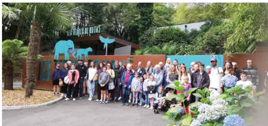
Sortie au zoo les terres de Nataé