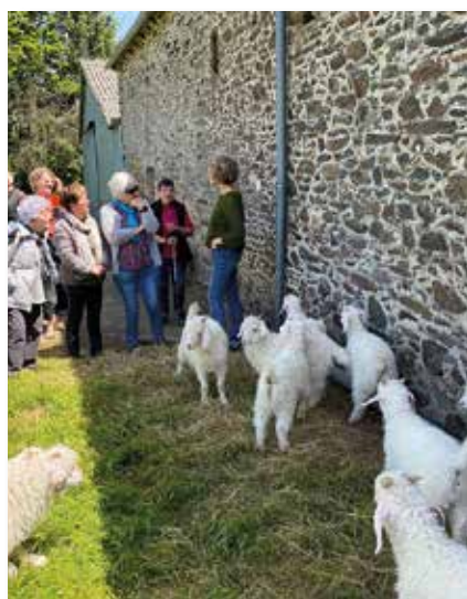
Visite de la ferme du Mohair