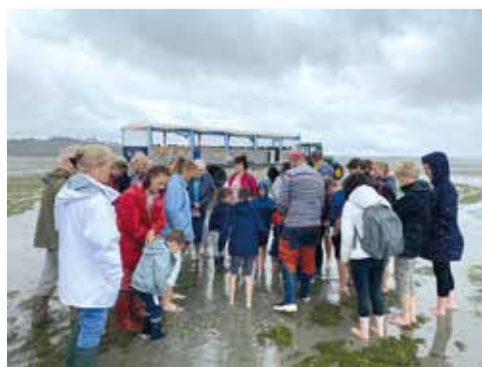
Visite de Mytilus (visite d'une exploitation de moules de bouchot en bateau-bus)