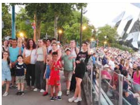
Séjour famille au Futuroscope