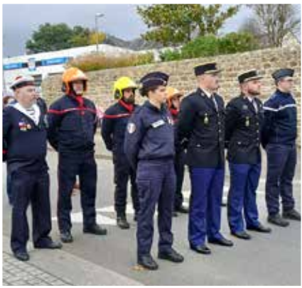
Présence de Plédranais(es) portant l'uniforme (Gendarmerie, police, pompier, marin)

La cérémonie s'est conclue par un vin d'honneur en mairie pour remercier les participants de leur présence.