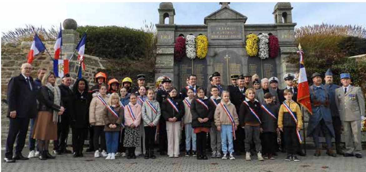
Autorités civiles et militaires, élus, CME, associations et figurants devant le monument aux Morts