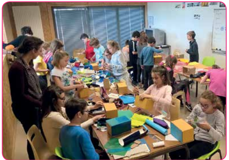
La classe pendant l'atelier pratique avec le collectif d'architectes Ty Archi

Le second atelier a été l'occasion d'aborder ces questions à l'échelle collective, puisqu'il s'agissait d'envisager les mêmes notions en réalisant une maquette en commun à partir des productions précédentes. Une façon de réaliser le lien entre architecture et urbanisme et de se préparer à la suite du programme grâce au jeu Archibourg, créé par le CAUE des Côtes d'Armor, et qui sera utilisé dès la semaine en classe.