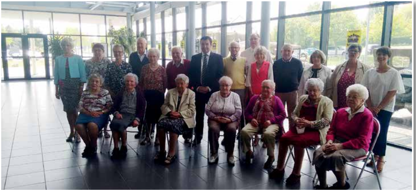
Les nonagénaires présents

Cette journée, toujours très attendue des aînés, s'est déroulée dans la convivialité.