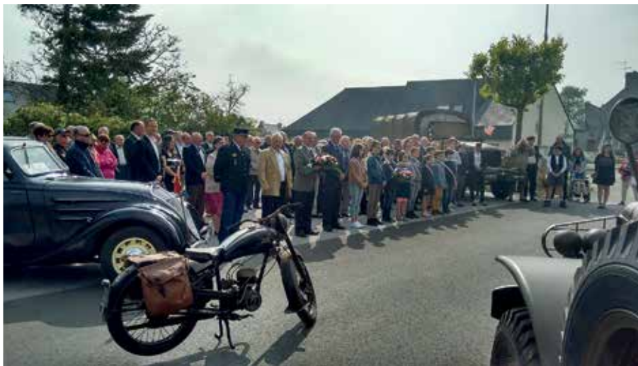
Véhicules stationnés devant le monument aux Morts

Toutes les générations ont ainsi fait honneur encore une fois en se recueillant devant les noms gravés sur les plaques du monument, en présence de véhicules militaires anciens de l'association Military Véhicule Conservation Group (MVCG).