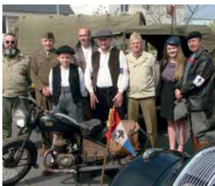
Conducteurs en tenue d'époque parmi leurs véhicules de l'association MCVG