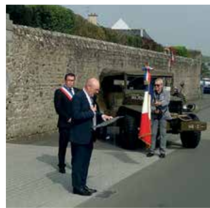
Lecture du discours de la Secrétaire d'État auprès du Ministre des Armées

Après la cérémonie, les véhicules convergeaient vers le centre-ville en s'arrêtant sur la Place de la Mairie, en passant par la rue du centre, pour ensuite stationner sur l'esplanade d'Horizon. Ces véhicules présents de l'association MVCG : Jeep Willys, Dodge Command car, GMC, Moto Gnome & Rhône ; les conducteurs et accompagnants en tenue d'époque.