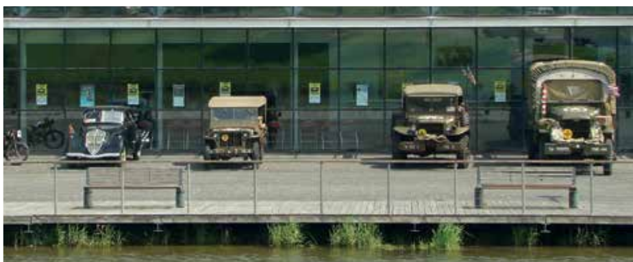
Véhicules stationnés sur l'esplanade d'Horizon.