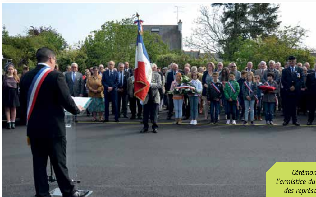
Cérémonie de célébration de l'armistice du 8 mai 1945 en présence des représentants officiels et des Plédranais.

C'est sous un beau ciel bleu et ensoleillé que la cérémonie de la fin de la guerre 39/45 a encore réuni un grand nombre de Plédranaises et de Plédranais, jeunes et moins jeunes. Ce rassemblement intergénérationnel devant le monument aux morts, en présence du Conseil Municipal Enfants (CME), rappelle une fois de plus que la solidarité au sein du peuple reste toujours intacte face au climat d'instabilité qui s'est inscrit dans le paysage.