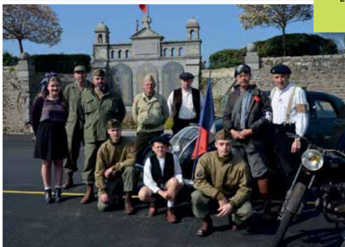
Les membres du Military Véhicule Conservation Group (MVCG).