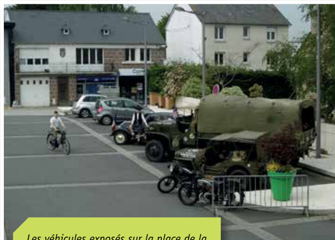
Les véhicules exposés sur la place de la marie : voiture, camion, motos, vélos...