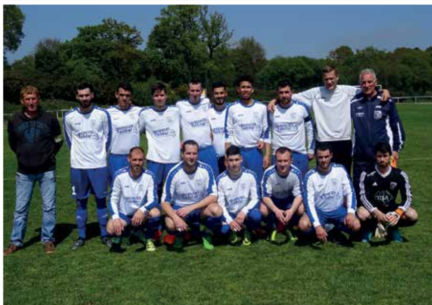
L'équipe B du CSP, lors de la rencontre à domicile, le dimanche 7 mai, contre Trébry où les Plédranais l'avaient emporté 10 buts à 0.

Mi-mai, au terme de la saison de football 2016-2017, les deux équipes A et B du CSP ont assuré leur maintien, en DSR pour l'équipe première et en 1 ère division de District pour l'équipe B. Les deux équipes se sont classées en milieu de tableau de leur groupe respectif. A noter que l'équipe A est arrivée aux portes de la finale de la coupe Ange-Lemée, et a été éliminée par Lannion B, en demi-finale de cette coupe départementale.