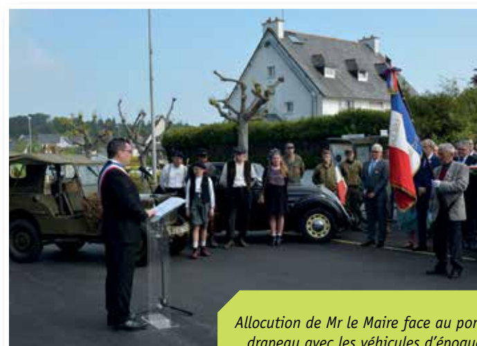
Allocution de Mr le Maire face au portedrapeau avec les véhicules d'époque dans le fond.