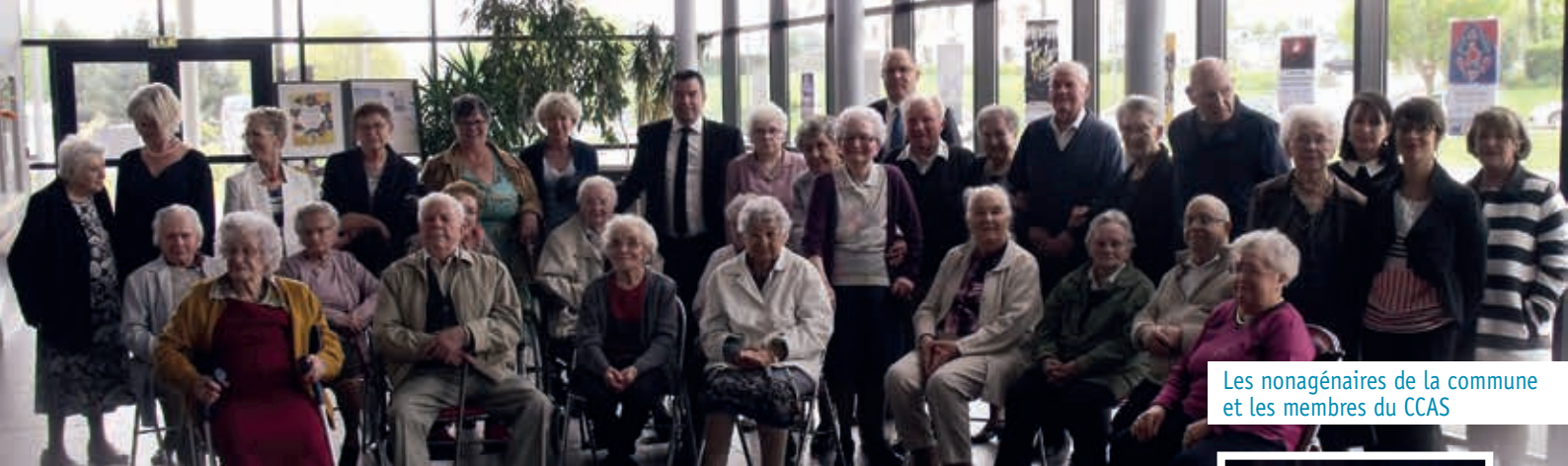
Les nonagénaires de la commune et les membres du CCAS