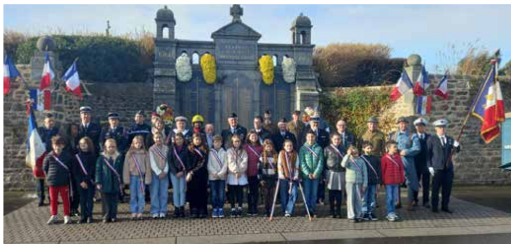
Autorités et CME devant le monument aux morts

Cérémonie intergénérationnelle et hommage à tous les « Morts pour la France »