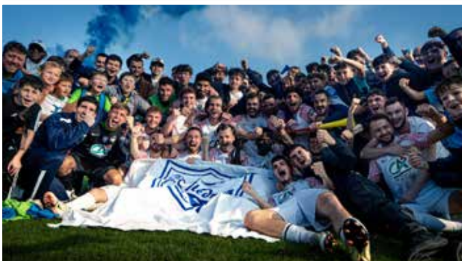
Joueurs et supporters à l'issue d'une victoire en coupe

Merci à toutes et à tous : vous êtes l'âme du CS Plédran.