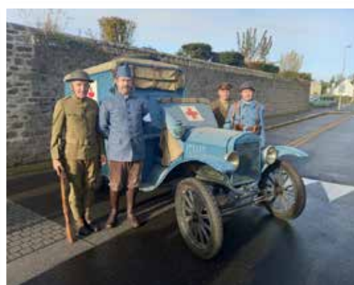
Ambulance Ford de 1917 ayant participé à la Grande Guerre, avec les bénévoles de l'association « Kitchen Guys » en tenues d'époque