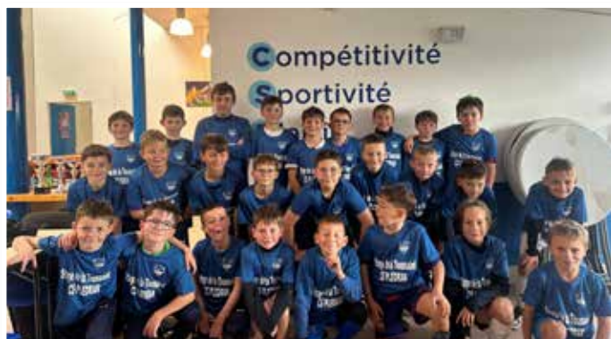
Stage U10-U13 à la Toussaint

Les vacances ont été rythmées par un stage riche et varié organisé par le club : pendant 4 jours, les 9-12 ans ont alterné séances d'entraînement, activités ludiques et découvertes sportives. Parmi les moments forts : visite du Roudourou, observation d'une séance d'entraînement des professionnels de l'En Avant de Guingamp, course d'orientation, oppositions, mais aussi olympiades, tournoi interne et match EAG-Clermont Foot 63.