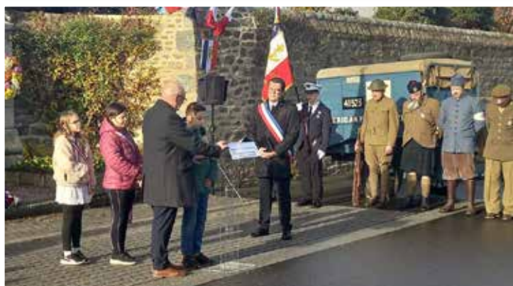
Lecture par le CME de lettres ou cartes postales envoyées aux soldats sur le front de la « der des ders ».

Les membres du CME ont terminé par la lecture de lettres et cartes postales de famille envoyées à leurs poilus. La cérémonie s'est conclue par un vin d'honneur en mairie.