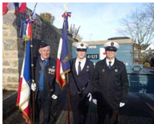
Portes drapeaux : Anciens Combattants et des Cols Bleus